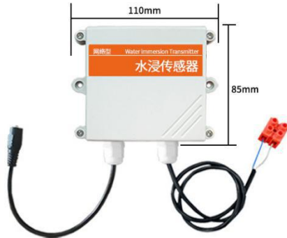
(4) GPRS 版本