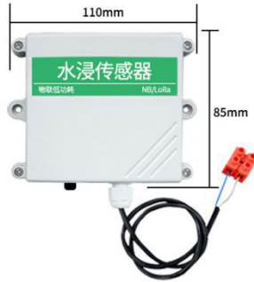
(3) 4G 版本