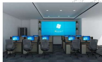
飞络 (成都) 7*24运维中心