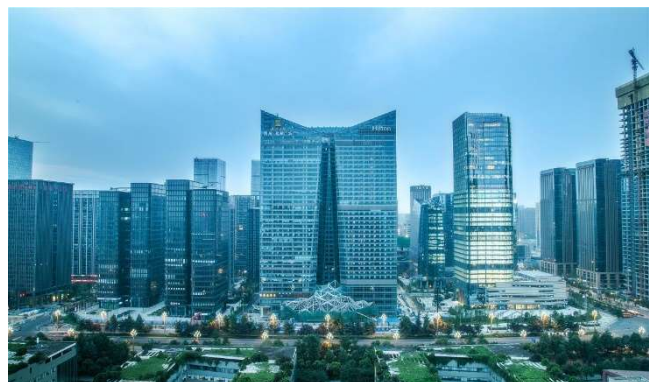
飞络 (成都) 7*24运维中心坐落于成都高新区