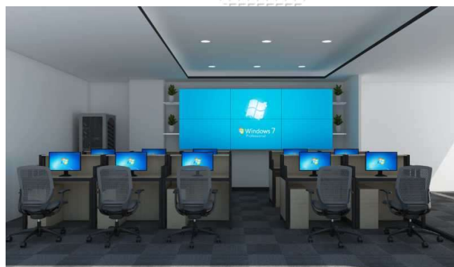
飞络 (成都) 7*24运维中心