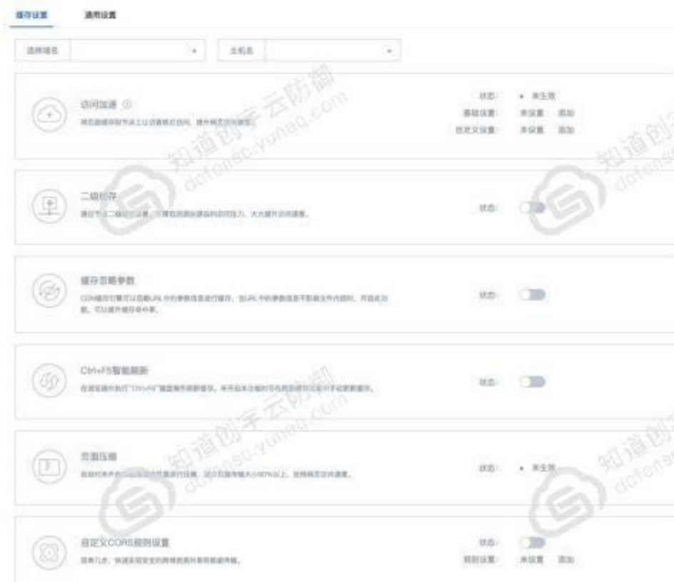
未选择域名主机名状态

用户进入功能管理页，需要先在下拉框中选择要进行配置的域名与主机名才能做后续操作。