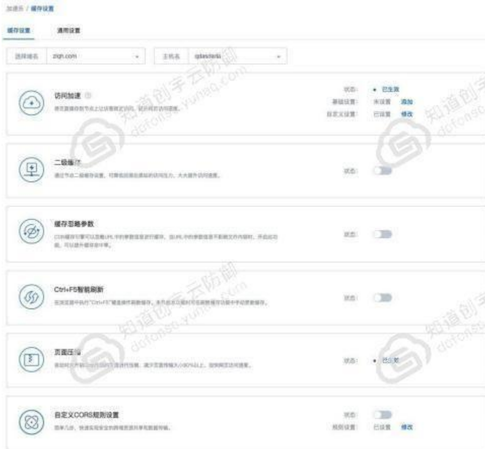
已选择域名主机名状态